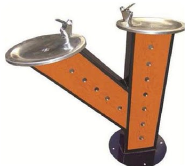
Opción panel de HPL