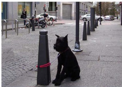
SECUENCIA ENCASTRE BOLARDO